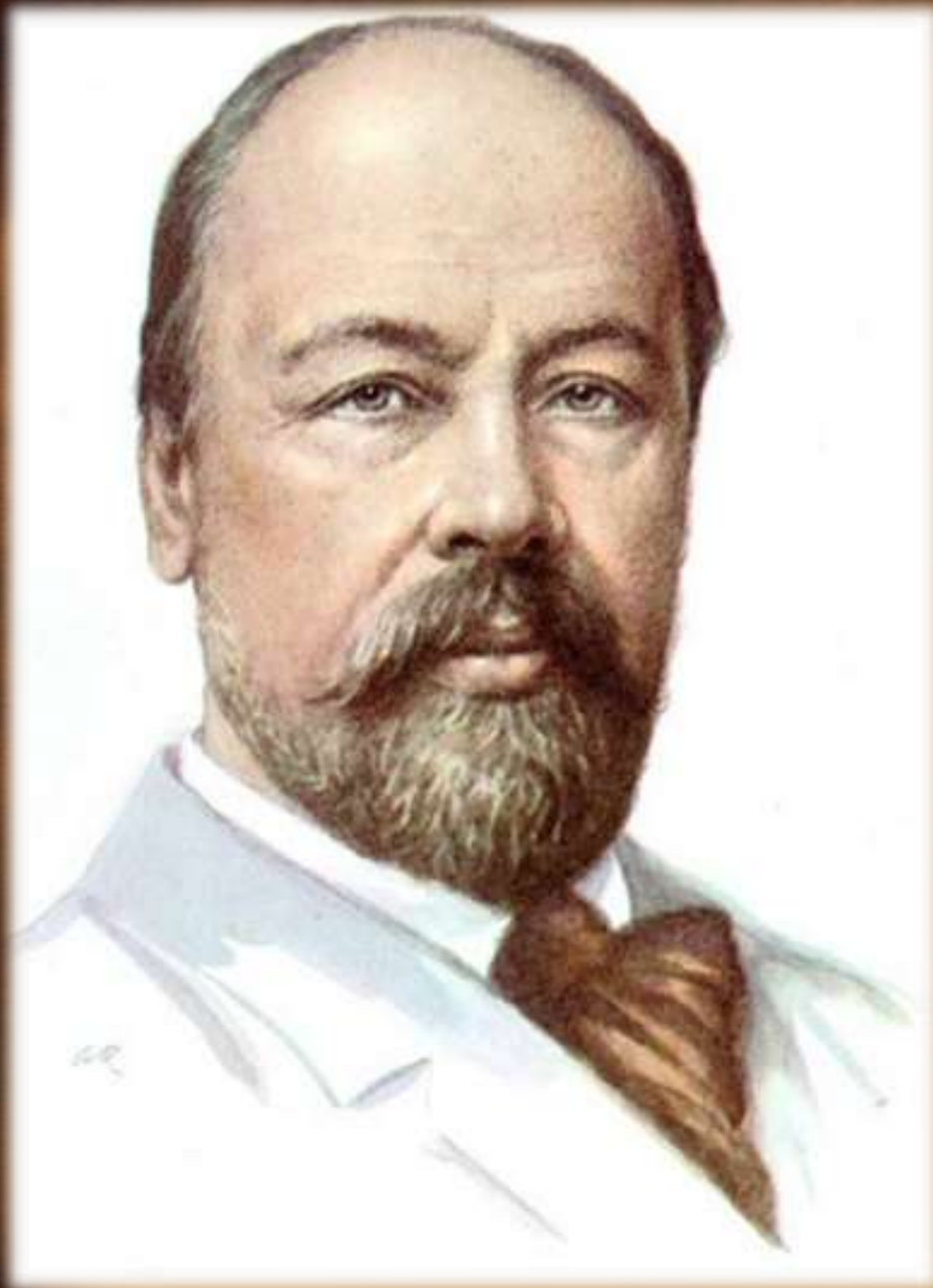
Анатолий Константинович Лядов